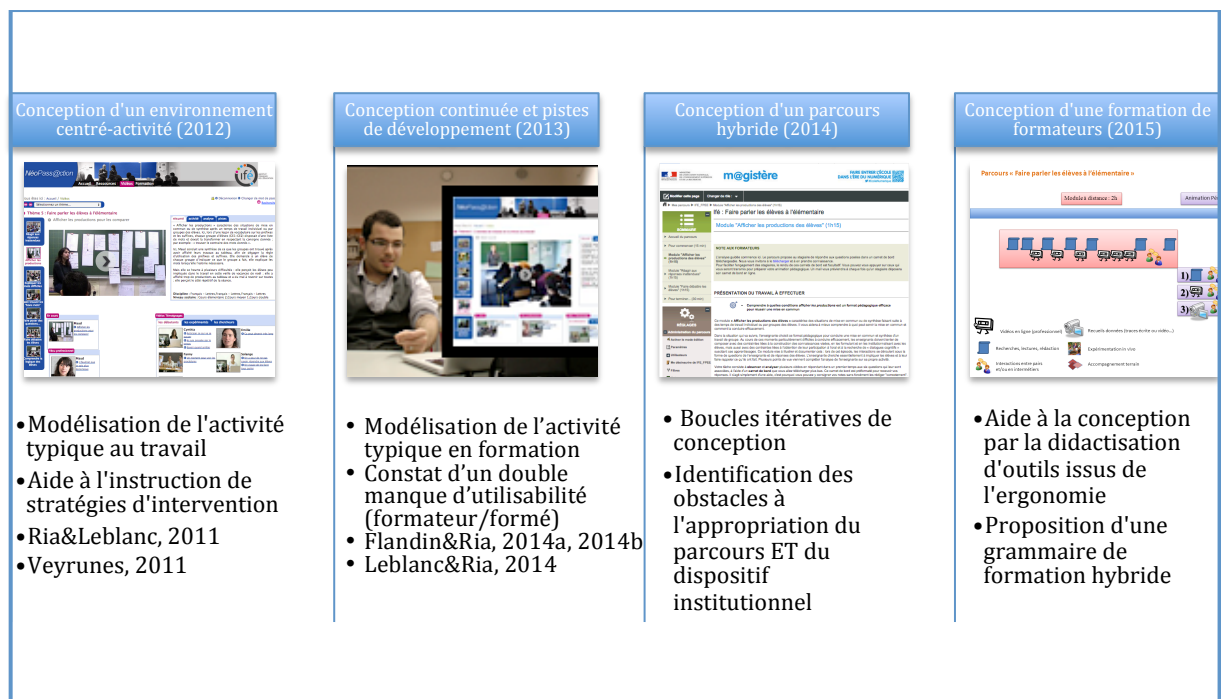
Figure 1 : Un programme de recherche-conception en formation des enseignants

Cette contribution rend compte de travaux récents menés dans un programme de recherche-conception en formation des enseignants, dans le cadre théorique du cours d'action (Durand, 2008). Débuté il y a une quinzaine d'années par l'étude de l'entrée dans le métier des enseignants et des moyens de l'accompagner (Durand, Ria & Flavier, 2002 ; Ria, 2001, 2006), ce programme a ensuite articulé de plus en plus systématiquement ses volets empirique et technologique, finalisé par la conception de situations de formation (Durand & Veyrunes, 2005 ; Flandin & Ria, 2014 ; Leblanc & Ria, 2014 ; Leblanc, Ria, Dieumegard, Serres & Durand, 2008 ; Ria & Leblanc, 2011, 2012 ; Ria, Leblanc, Serres & Durand, 2006). Cette contribution s'intéresse en particulier aux travaux menés entre 2011 et 2015, et plus précisément à ceux réalisés autour de la vidéo et du dispositif NéoPass@ction 1 . Nous en exposons quelques réalisations majeures en expliquant comment s'y articulent analyse du travail par le chercheur-concepteur, par le formateur et par l'enseignant, et en quoi cela participe du développement professionnel des acteurs.